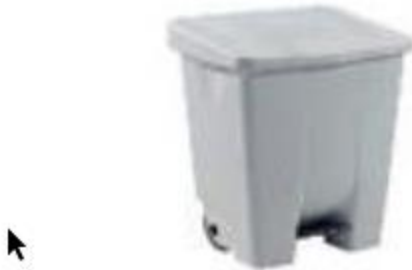
Figura 3 – Ejemplo de un contenedor con tapa y control no manual

Las mascarillas se deben desechar en un contenedor provisto de una bolsa de plástico (preferiblemente con tapa y control no manual, véase la figura 3). Se recomienda utilizar doble bolsa para preservar el contenido de la primera bolsa en caso de desgarro de la bolsa exterior.